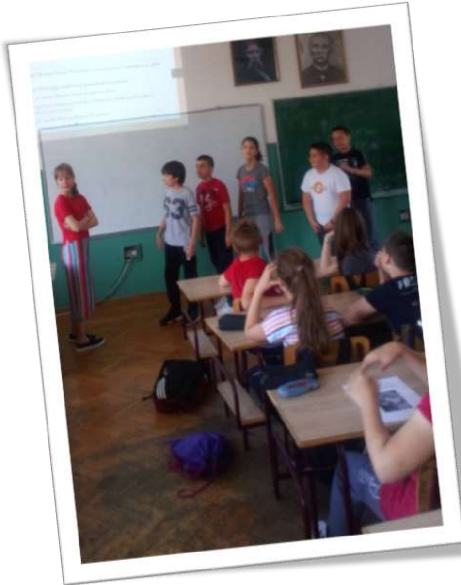
Биографија Марка Твена 5/1