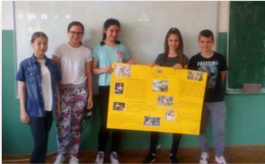
Смерика и Мисисипи 5/3