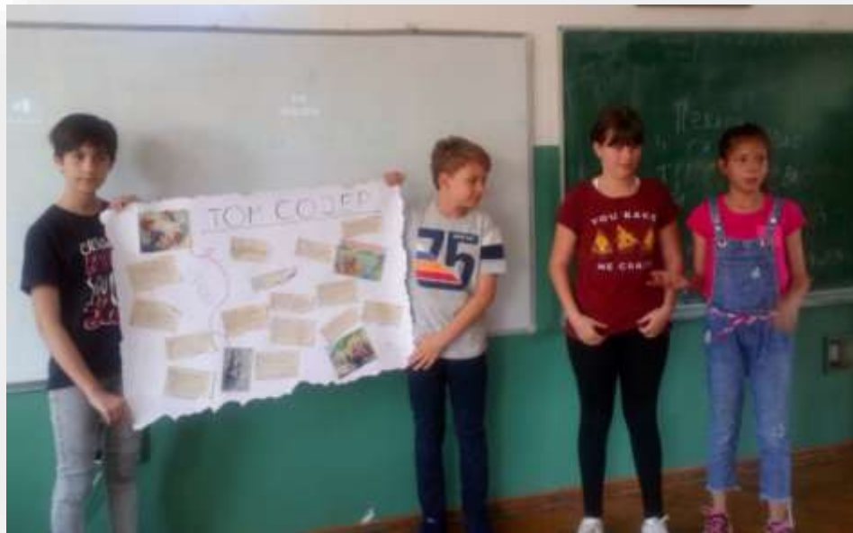
Ликови у роману Том Сојер 5/3